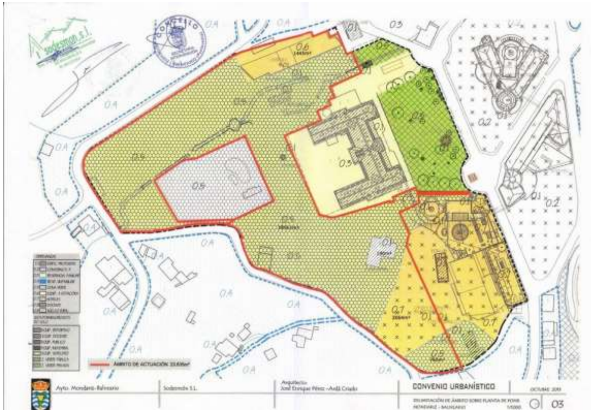
PLANO da delimitación do ámbito de actuación sobre o POMR.

sendo de titularidade pública os xardíns do fronte do Gran Hotel e de titularidade privada o resto.